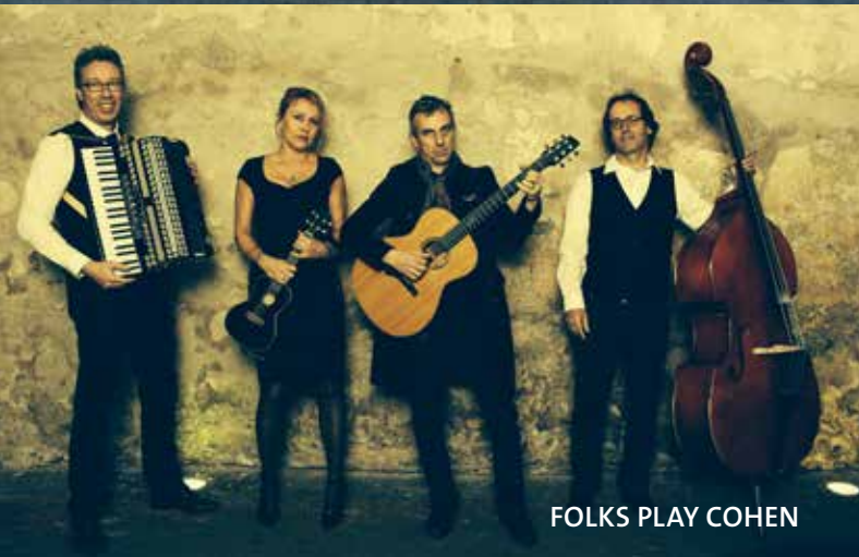
FOLKS PLAY COHEN