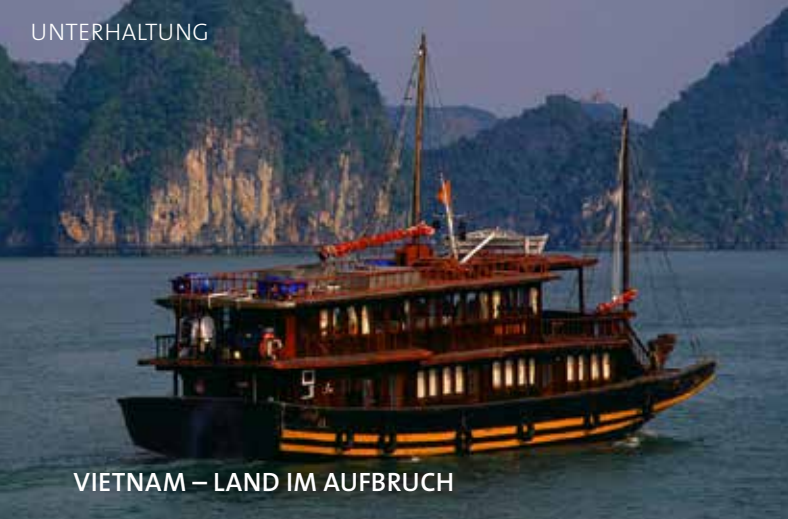
VIETNAM – LAND IM AUFBRUCH