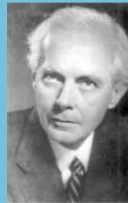
Abbildungen von links: Gustav Mahler ; Béla Bartók ; Igor Stravinsky ; Arnold Schönberg ; Leoš Janáček ; Giacomo Puccini ; Oliver Messiaen